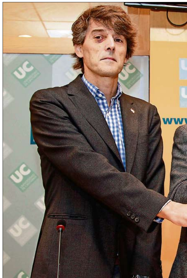
Presentación de la Semana de la Ciencia.

El plazo de entrega se encuentra abierto hasta el 7 de noviembre y los trabajos presentados se expondrán en la Facultad de Ciencias del