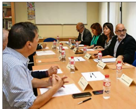
Reunión del Patronato de la Fundación.